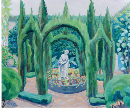
Patio de la Madama (Córdoba)