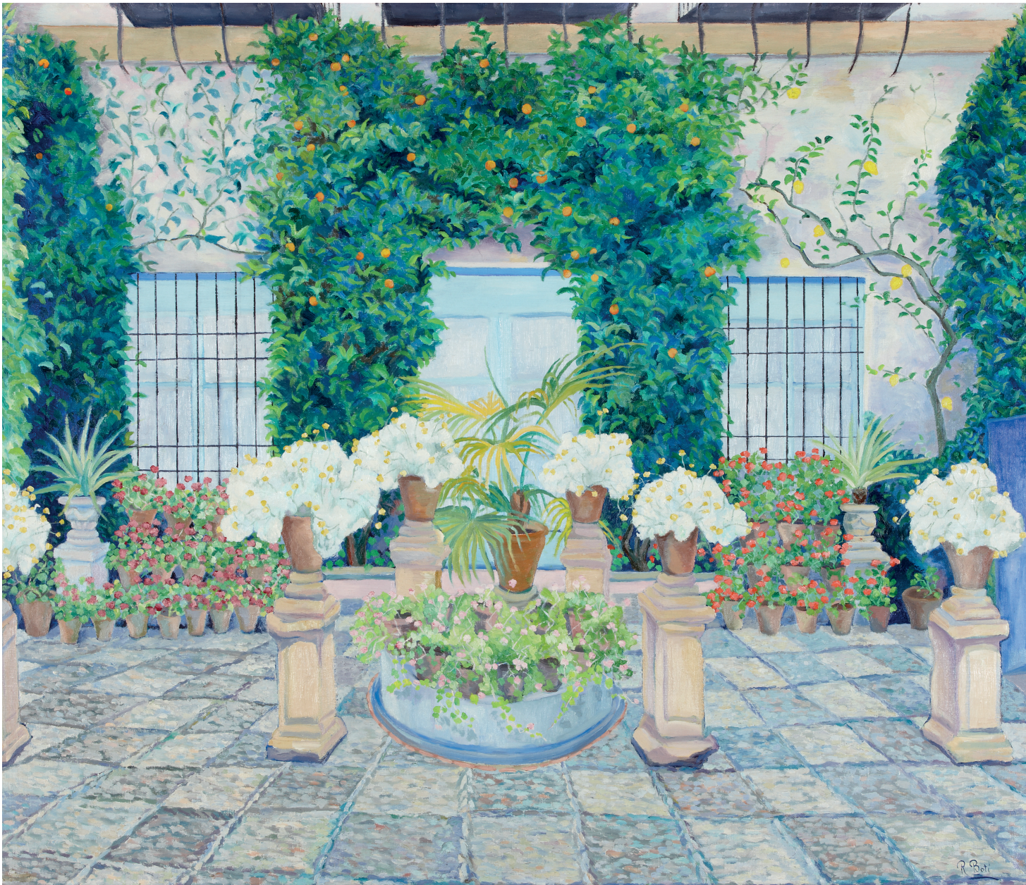
Un patio de las Rejas de Don Gome (Córdoba)

His work is to be found in numerous collections. In Madrid: Museo Nacional Centro de Arte Reina Sofía, Museo Municipal, Museo de la Ciudad, Museo de la Real Academia de Bellas Artes de San Fernando, Palacio de Liria (home of the Duke of Alba), Madrid City Council, Ministry of Labour, Tabacalera, and Banco de Madrid. In Córdoba: Museo Provincial de Bellas Artes, Museo Taurino, City Council, Provincial Council, Fundación Provincial de Artes Plásticas Rafael Botí, Real Academia de Ciencias, Bellas Letras y Nobles Artes de Córdoba, Conservatorio Superior de Música, Cajasur, Patronato Lozano Sidro and Diario Córdoba. In Zaragoza: Museo Camón Aznar. In Cuenca: Provincial Council. In Almería: Cuevas de Almanzora, Museo Campoy. In Bilbao: Museo de Bellas Artes, Asociación de Artistas Vascos. In La Coruña: Museo Camilo José Cela. In Nerva (Huelva): Museo Vázquez Díaz. In Seville: Palacio de las Dueñas (home of the Duke of Alba), Museo de Bellas Artes. In Jaén: Museo Provincial. In Huelva: Museo Provincial. Botí died in Madrid on 4 February 1995. In 1998, the Córdoba Provincial Council created the Fundación de Artes Plásticas "Rafael Botí".