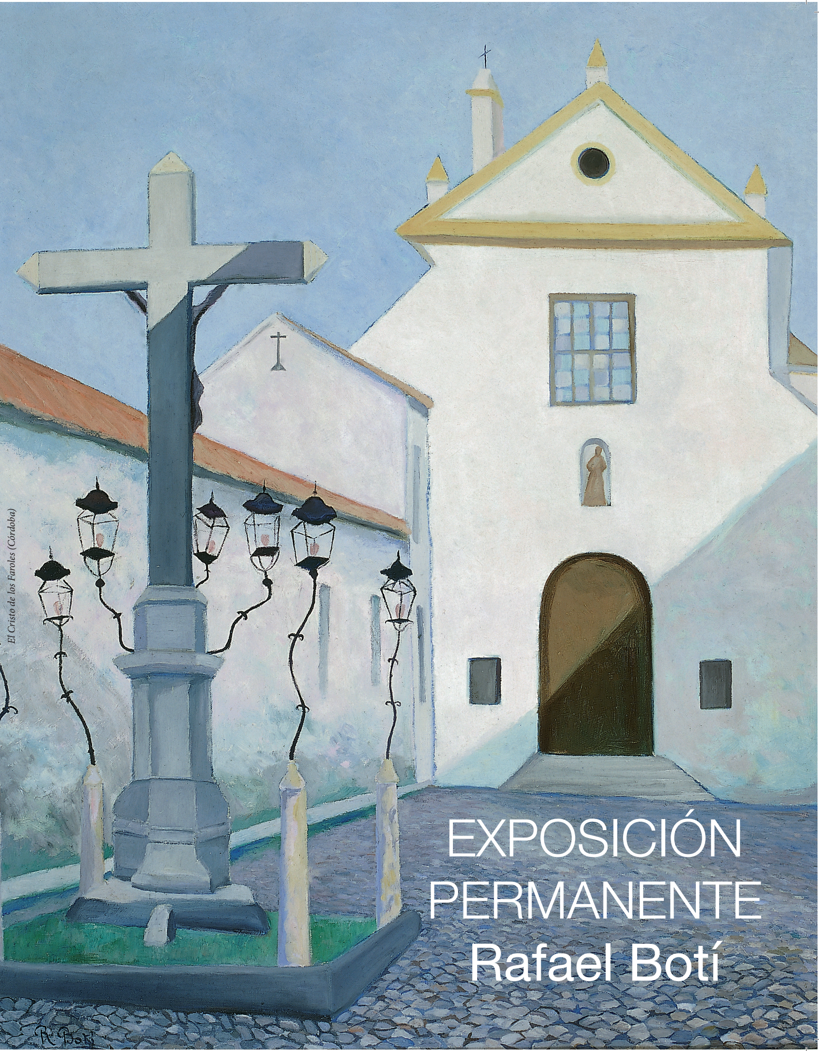
El Cristo de las Farolas (Córdoba)

BOTÍ Fundación Provincial de Artes Plásticas Rafael Botí Diputación de Córdoba