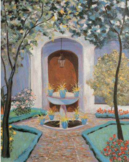
Patio antiguo (Córdoba)

El Ayuntamiento de Córdoba le designa Hijo Predilecto y le concede la Medalla de Oro de la Ciudad en 1979, y en ese mismo año la Real Academia de Ciencias, Bellas Letras y Nobles Artes, le nombra Académico Correspondiente; la Asociación de Artistas Plásticos Cordobeses, su Presidente de Honor; la Academia Libre de Arte y Letras de San Antón, le otorga el rango de Académico Ilustre. Fue galardonado en la Exposiciones Nacionales de los años 1924 y 1964 y en la Regional de Artistas Andaluces de Granada en 1930. En 1980 el Ministerio de Cultura le concede la Medalla al Mérito en las Bellas Artes. En 1990 es elegido por designación popular “Cordobés del Año” y en 1992 le es concedido el Premio Especial del Jurado en los Premios Nacionales de Artes Plásticas.