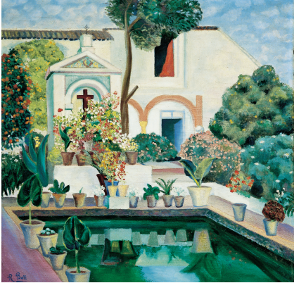
El patio de la Fuensanta (Córdoba)