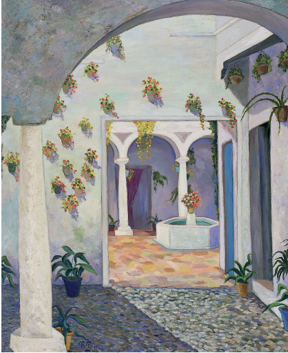
Patio de la Judería (Córdoba)