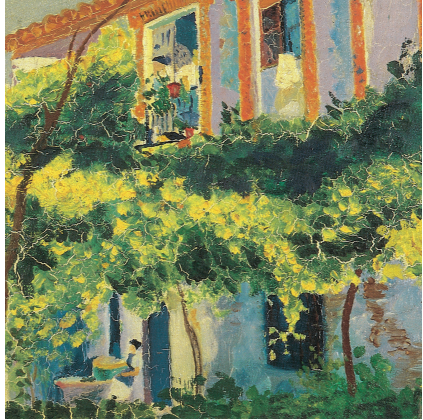
Calle Santiago (Córdoba)