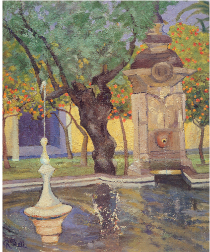
La fuente del olivo (Córdoba)